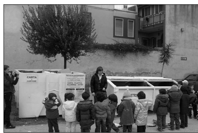
Un'immagine della lezione di "differenziata"

profitto, guadagno che verrà destinato all'intera comunità se gestito nel modo migliore possibile. Inoltre, - continua -, noi del comitato stiamo mettendo in pratica tutto questo per una giusta causa, risolvere Marcianise da una morte sicura, almeno sotto il profilo ambientale. I cittadini hanno bisogno delle istituzioni e anche noi come comitato riteniamo opportuno fare la nostra parte, affinché si possa realmente trovare presto risoluzione ad un disagio che non sembra trovare mai un fine".