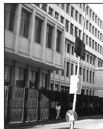
Sentenza emessa a S. Maria C.V.